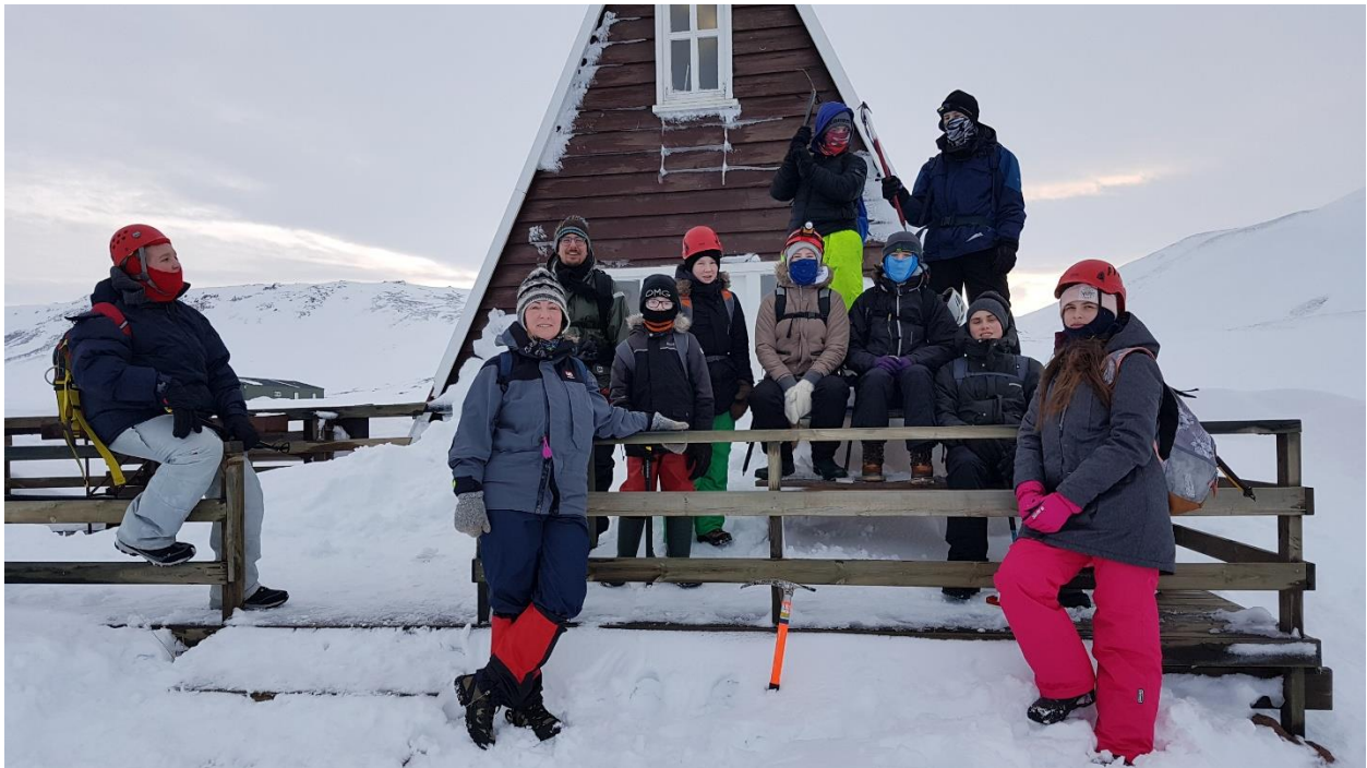
Á Þeistareykjum – Mynd: Kristján Ingi Jónsson