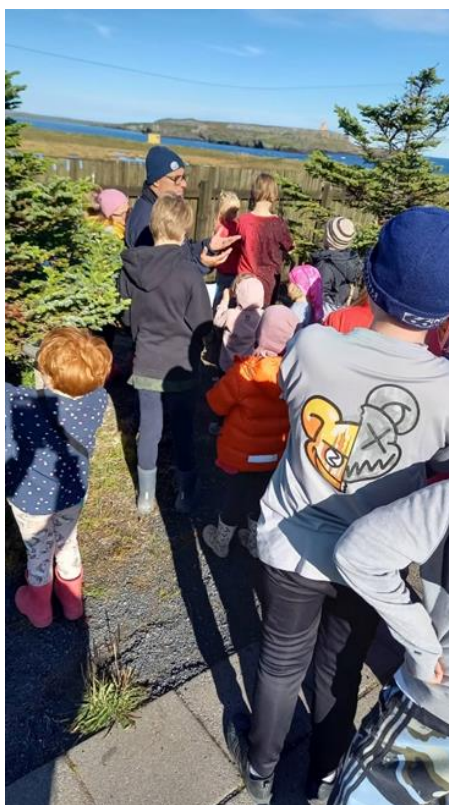
Fuglaverkefnið – samstarf við Grunnskóla Raufarhafnar og Rif rannsóknarstöð