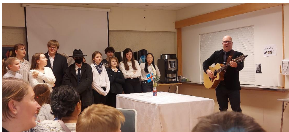
Vorgleði skólans 2023

Samþætt þemaverkefni eru farin að skipa stærri sess í skólastarfinu og þeim lýkur alltaf á kynningum fyrir samnemendur, starfsfólk og foreldra. Í vetur var haldin kynning fyrir foreldra með yfirskriftinni Vísindakaffi með risaeðluívafi. Yngri deildin hafði verið að fræðast um risaeðlur en eldri deild í efnafræði og tilraunum sem voru sýndar á foreldradeginum. Síðasti stóri viðburðurinn í Öxarfjarðarskóla var Vorgleði skólans sem bar að þessu sinni yfirheitið Saga Íslands . Nemendur skipuleggja hátíðina í samstarfi við kennara og foreldra sem aðstoða við matargerð. Á Vorgleði er boðið upp á þriggja rétta máltíð sem nemendur og foreldrar sjá um en nemendur eru alfarið með dagskrána í sínum höndum; veislustjórn, kynningar og tónlistaratriði en einnig er lagt upp úr því að virkja gesti til þátttöku.