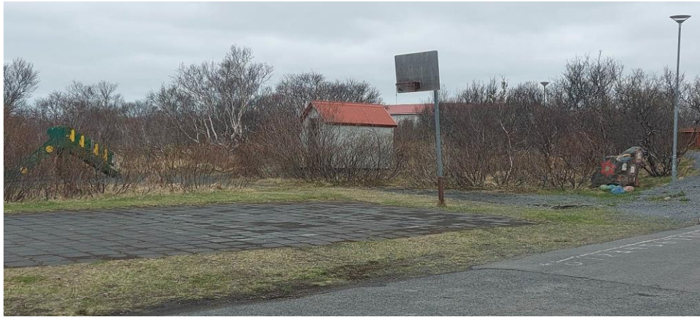
Körfuboltavöllurinn þarfnast lagfæringar