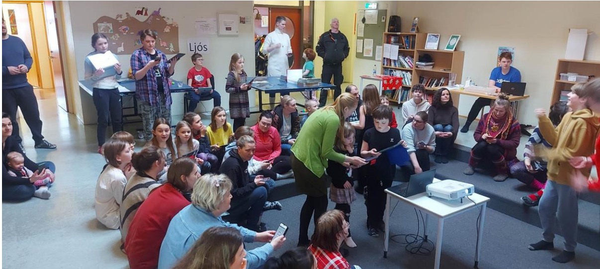
Foreldrar virkir þátttakendur í kynningu hjá nemendum eftir þemavinnu– Vísindakaffi með risaeðluívafi