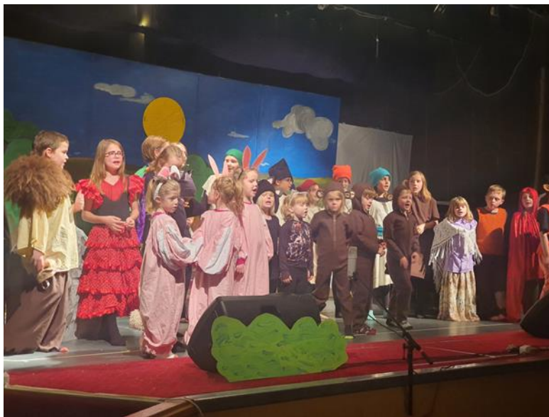
Sameiginleg árs hátíð skólanna haldin á Raufarhöfn haustið 2022

Skólanámskrá var endurskoðuð og er almenni hluti hennar tilbúinn. Ekki gekk að koma námsvísi saman né heldur kennsluáætlunum í eitt og sama formið ásamt formlegu utanumhaldi um námsmat. Ákveðið hefur verið að taka Mentor kerfið í gagnið í Öxarfjarðarskóla frá og með haustinu 2023 þar sem allt utanumhald um kennsluáætlanir og námsmat auk annarra atriða er varða skólastarfið verður á einum stað.